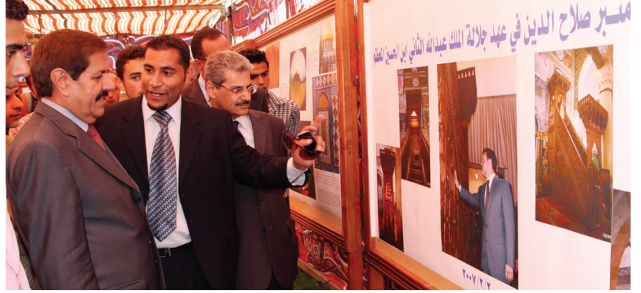
الدكتور الكركي امام صور لمنبر صلاح الدين الذي أعيد بناؤه في عهد جلالة الملك

وقام (بنك الدم الوطني) بإجراء العديد من الفحوصات الطبية قبل التبرع للتأكد من خلو المتبرعين من الأمراض، وقد شهدت هذه الحملة إقبالاً كبيراً من طلبة الجامعة حيث شارك فيها أكثر من ٤٠٠ طالب وطالبة.