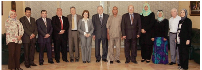
أعضاء هيئة تدريس عراقيون مشاركون في البرنامج التدريبي