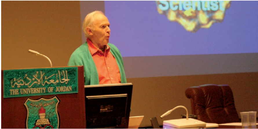
البروفيسور كروتو متحدتاً عن تطورات ميادين العلوم التطبيقية

الجامعة - أكد العالم البروفيسور «هارولد كروتو» على ضرورة خلق المبادرات التعليمية التي تسهم في تطوير النظام التعليمي في الجامعات، لافتاً إلى أن العالم يشهد قفزة نوعية في ميادين العلوم التطبيقية والهندسة بكافة فروعها ومجالاتها التخصصية.